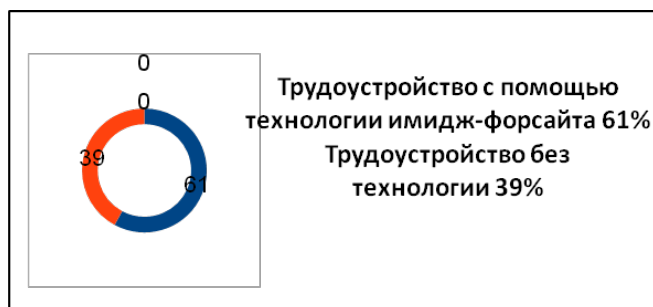
Рис. 2. Зависимость трудоустройства выпускников вуза от технологии образовательного имидж-форсайта