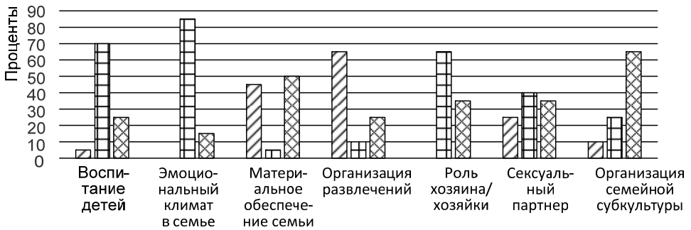
Рис. 2. Распределение ролей в семье (данные по девушкам):