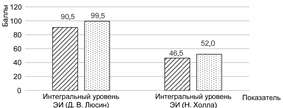
Рис. 2. Выраженность показателей интегрального уровня эмоционального интеллекта по методикам в ЭГ до и после реализации программы (Me):

На рис. 2 представлены показатели до и после реализации программы. При этом, как видно из рис. 2, в экспериментальной группе повысился уровень эмоционального интеллекта.