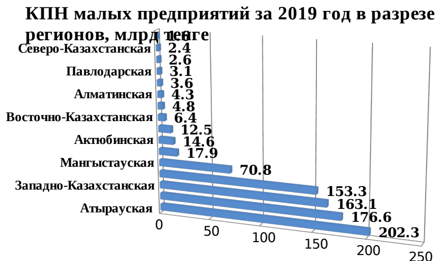
Рисунок 1 – Поступления КПН от МП в разрезе регионов за 2019 г. Примечание: составлено автором по источнику [11].

На данном рисунке представлена структура налоговых поступлений по КПН от субъектов малого предпринимательства в разрезе регионов. Как видно, наибольший вклад в бюджет приносит малое предпринимательство из Атырауской области. На долю города Алматы приходится 153,3 миллиарда тенге. Для более наглядного представления представим данные в долях от итоговой суммы поступлений в бюджет.