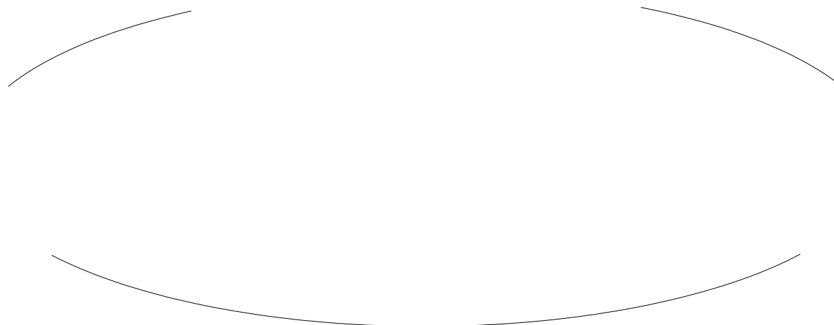
Рисунок 2 – Системное взаимодействие университетов по направлению подготовки «Реклама и связи с общественностью»

Представленная на рисунке 2 система показывает, что системное взаимодействие может осуществляться не только в рамках двух вузов, но и в трех. Это усложняет процесс обучения для обучающегося, а также усложнение методического и документационного сопровождения обучения.