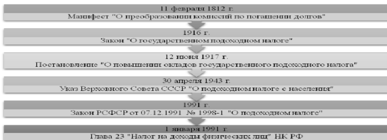
Рисунок 1. Отечественная практика формирования НДФЛ

Таким образом, пройдя данные этапы истории НДФЛ к 2001 году в России сформировался фиксированный тип налога, облагаемый на физических лиц, проживающих в России не менее 183 дней в году, имеющие доходы от источников в России.