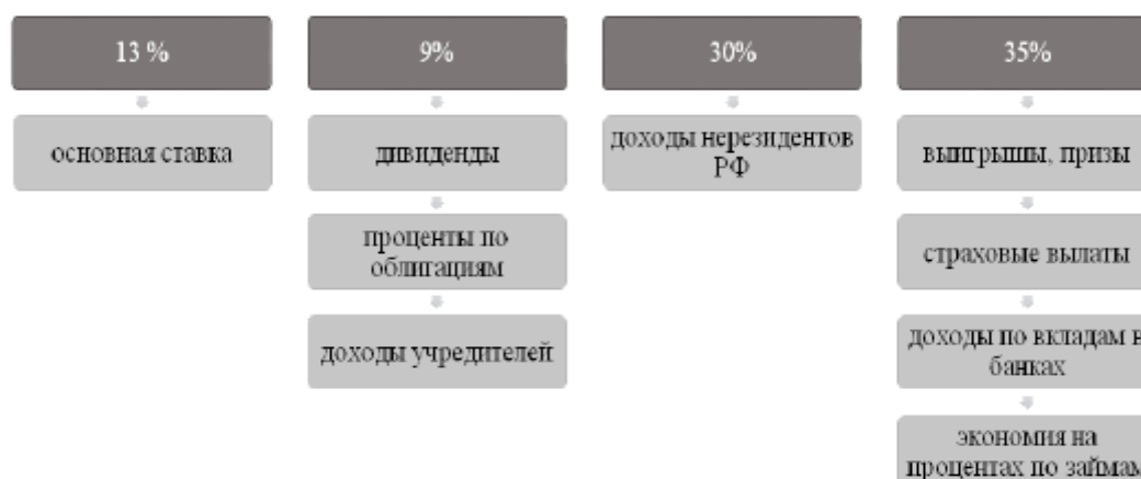
Рисунок 3. Ставки НДФЛ, действующие в РФ

Многие западные страны применяют прогрессивную шкалу налогообложения, Российская Федерация же применяет на своей практике пропорциональную шкалу. Ставка налога зависит от того, кем является налогоплательщик, какой статус занимает в обществе, а также в зависимости от источников получения ими дохода.