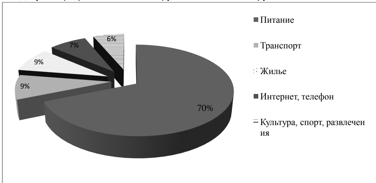
Рисунок 1 - Структура месячного бюджета студента

лье– 700 рублей; транспорт – 700 рублей; интернет, телефон – 600 рублей; культурный досуг, спорт, развлечения – 500 рублей. ИТОГО: 8000 рублей.