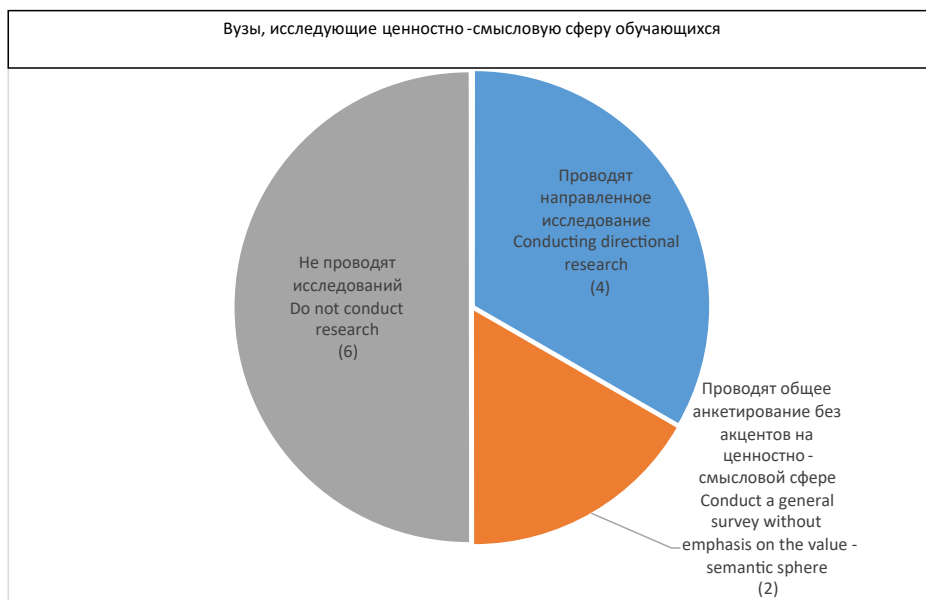
Рис. 3. Количественные данные по вузам, исследующим ценностно-смысловую сферу обучающихся

Исследование содержания программ воспитания на предмет наличия инструментов исследования социокультурной идентичности субъектов воспитательной деятельности показало, что в половине вузов не предусмотрены процедуры получения данных о социокультурных характеристиках субъектов воспитательной деятельности. Из этого следует вполне закономерный вывод об отсутствии в этих вузах обоснованных представлений о том, с какими культурными образцами соотносят себя обучающиеся, обучающие, организаторы воспитательной работы и др.