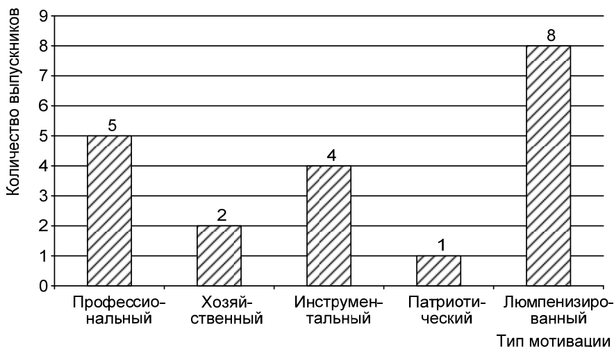
Рис. 3. Количественное распределение выпускников детских домов по ведущему типу мотивации

Результаты исследования по тесту «Типы мотивации» Владимира Герчикова представлены на рис. 3.