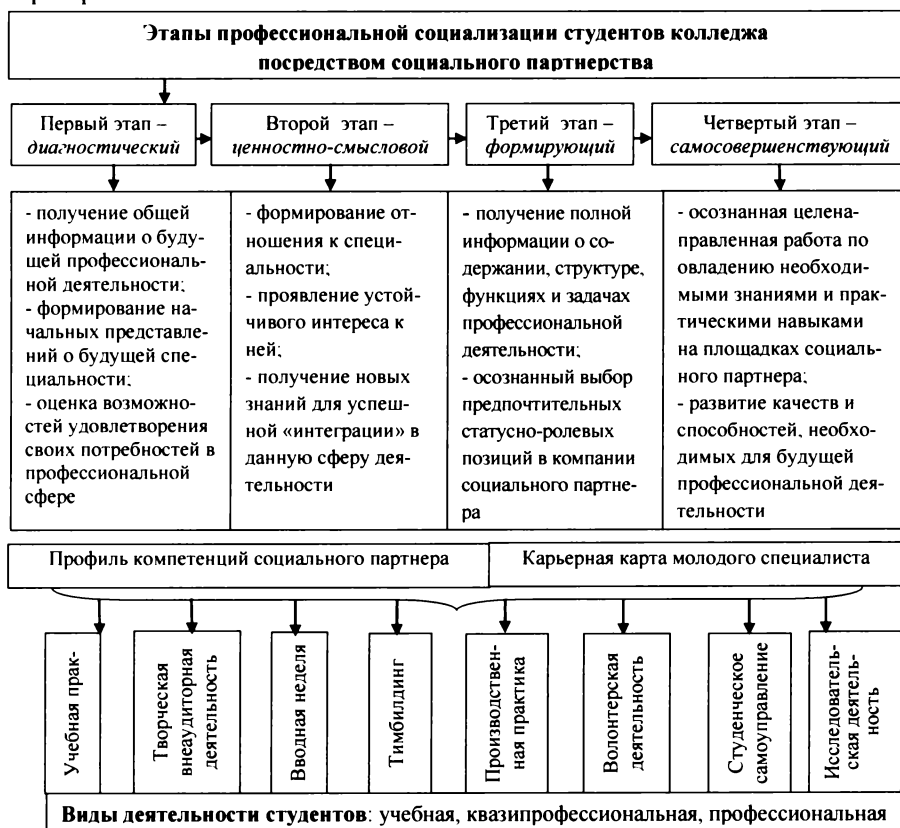
Рис 2. Этапы профессиональной социализации студентов колледжа посредством социального партнерства

Направлениями совместной деятельности партнеров являются участие в организации и реализации образовательного процесса, разработка нормативной базы обучения, формирование учебно-методического сопровождения, оснащение образовательной базы (экспериментальная площадка социального партнера, Ресурсный центр горно-металлургической отрасли, производственные цеха социального партнера на двух заводских площадках, мастерские, лабораторный корпус) и выявление основных этапов профессиональной социализации студентов колледжа (рис. 2). Этапы профессиональной социализации студентов реализуются путем использования специально созданного социальными партнерами Профиля компетенций , который представляет собой совокупность личностных, методических, социальных и профессиональных компетенций, и Карьерной карты молодого специалиста, определяющей перспективные возможности профессионального продвижения студентов колледжа в компании социального партнера.