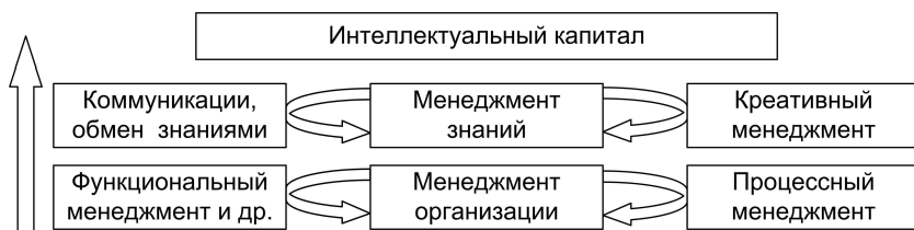
Рис. 3.2. Креативный менеджмент в системе менеджмента

стью приложения существующих дисциплин менеджмента (функциональный менеджмент, менеджмент-маркетинг, инновационный менеджмент, управление персоналом и др.) является организация, ядром – менеджмент организации, а операциональной системой – процессный менеджмент, то в области, где ядром становится менеджмент знаний, операциональной системой уже является креативный менеджмент, а целью – приращение интеллектуального капитала. На рис. 3.2 представлено место креативного менеджмента в системе менеджмента.