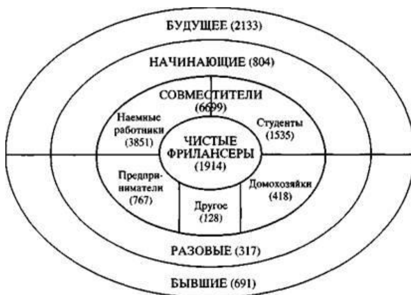
Рис. 4 - Биржа фриланса Free-lance.ru

Многие молодые специалисты, получив в учебных заведениях определенные профессиональные знания, выходят на рынок труда психологически и социально неподготовленными к его жестким условиям. В частности, закончивший учебное заведение молодой человек зачастую не имеет представления о состоянии рынка труда, не может объективно оценить, насколько его подготовка и запросы соответствуют возможностям их удовлетворения, на фоне завышенной самооценки у него нередко формируется иждивенческая, пассивная позиция, что проявляется в отношении к поиску работы и выполнению трудовых обязанностей.