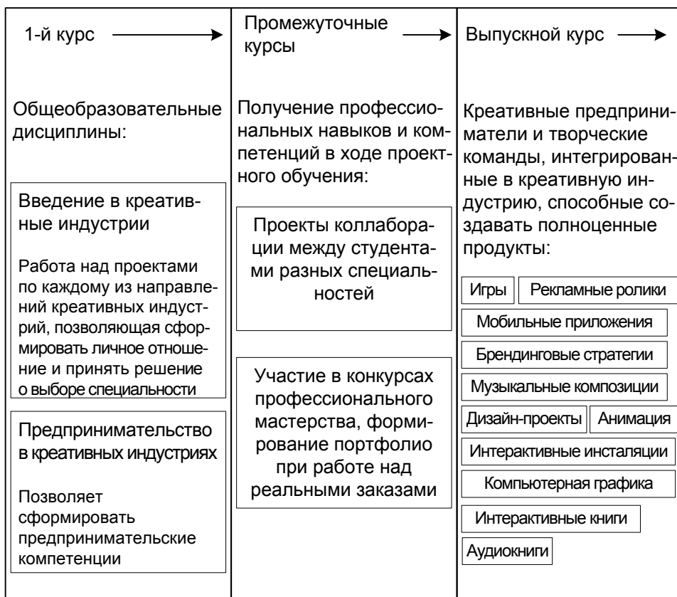
Рис. 2. Структура образовательного процесса

Структура образовательного процесса (рис. 2). Образовательный процесс призван обеспечить каждому выпускнику, как уже говорилось, прохождение и проживание пути освоения профессии от знакомства со сферами креативных индустрий и самоопределения в верности выбора до освоения профессионального, проектного, предпринимательского мастерства и достижения готовности к трудовой деятельности. В креативных индустриях происходят постоянные изменения, касаемые трендов и модных течений, что усложняет работу. В связи с этим как педагогам, так и студентам необходимо понимание не только своего, но и смежных направлений [11].