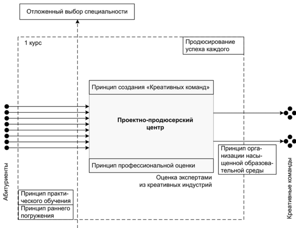
Рис. 1. Модель образовательного процесса

обучающимися всего жизненного цикла от освоения стандартов, норм профессиональной деятельности до проб, создания, выведения на рынки конкурентоспособных продуктов.