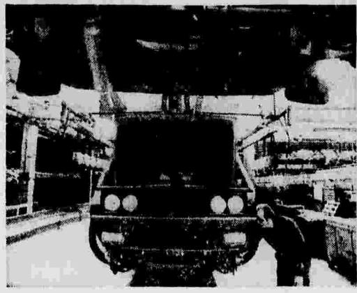
Автомобилестроение — одна из ведущих отраслей промышленности Польши. Ежедневно на сборочных конвейерах автозаводов республики выезжают грузовые и легковые автомобили, автобусы и специализированные машины...