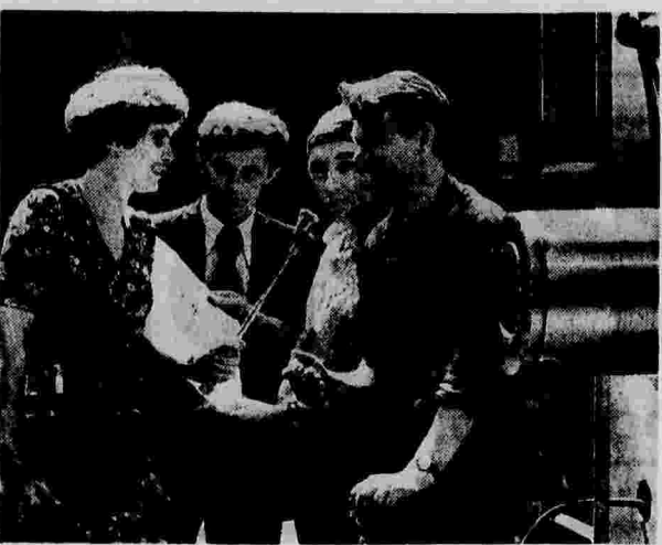
Партийная организация «Атомаша» устроила для своих работников семинар по вопросам повышения квалификации...