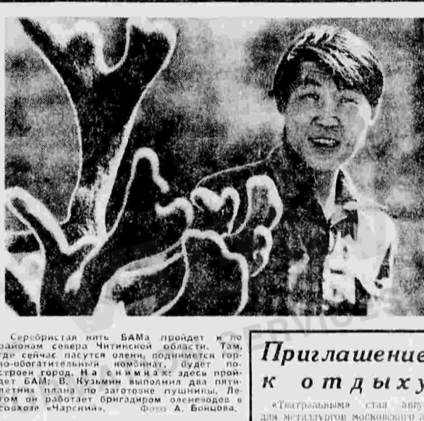
Серьбистая нить БАМА проедет и по районам сельхоз Могилевской области. Там, где сейчас пасутся оленя, поднимается горно-обогатительный комбинат. Будет построен город. На смену ему придет БАМ. В Кузьминке выделены для строительства заготовки пшеницы, Лептом на планете Бригадом оленеводов в совхозе «Чарские».