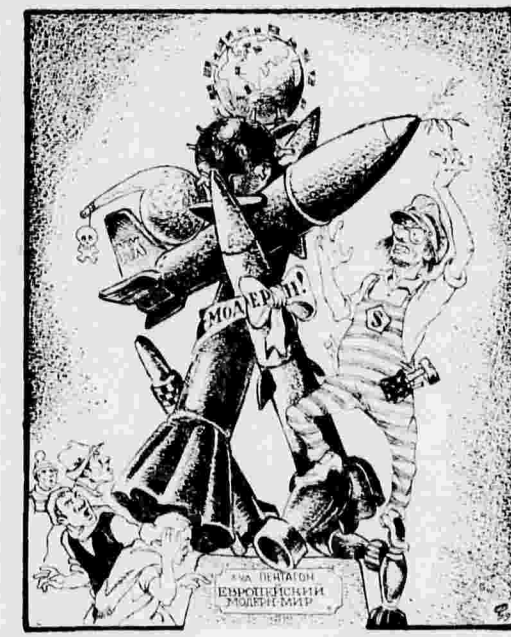
Заморский «модернист» в Западной Европе. Рис. В. Фомичева.