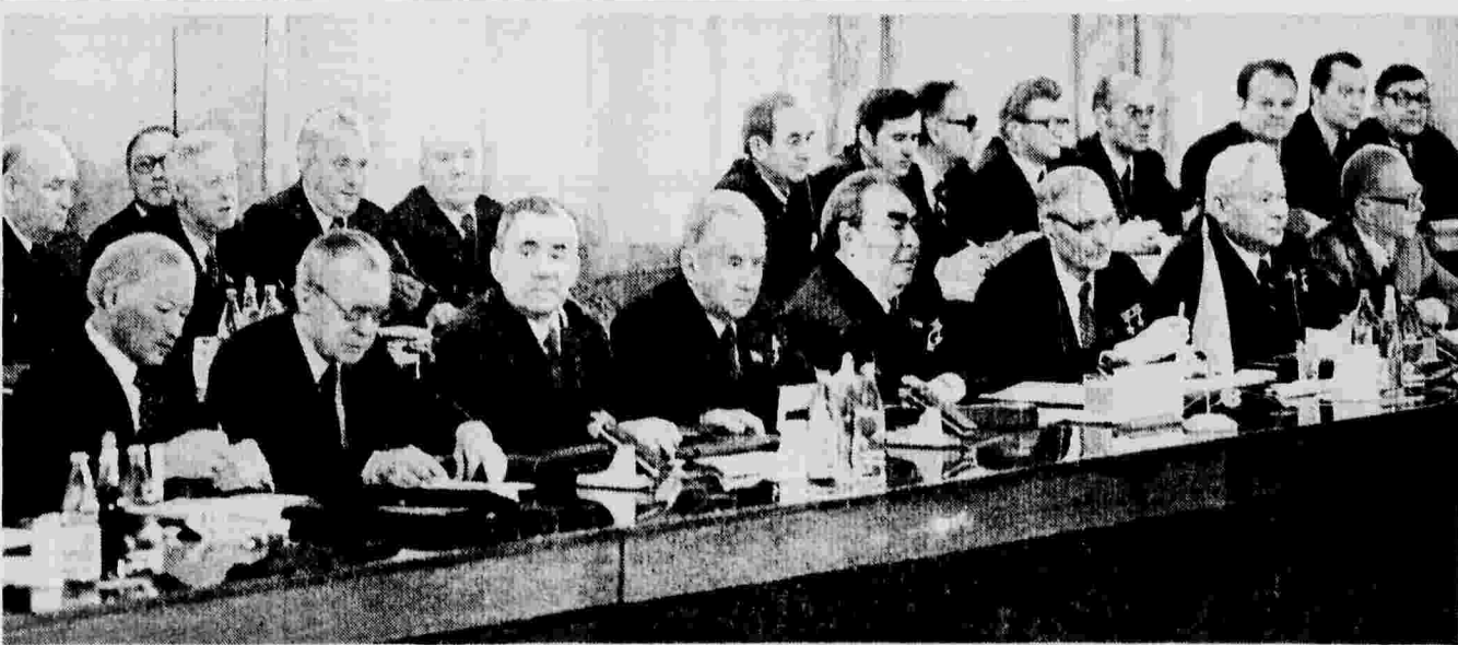
Советская делегация в зале совещания Политического консультативного комитета.