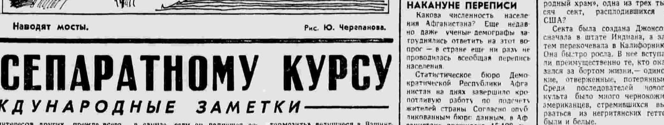
Наводят мосты. Рис. Ю. Черепанова.

В уклад нефтяным монополиям американская военщина планирует усиление своего присутствия на Ближнем Востоке.