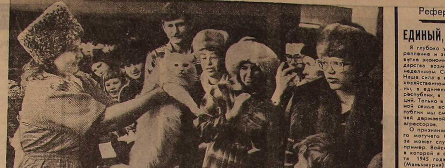
Во Дворце культуры имени Лаврова прошла выставка кошек, вызвавшая большой интерес свердловчан.

На автозаправочной станции по улице Коммунистической произошел любопытный инцидент: оператор отделения заправивший бензин «Жигулям», сославшись на отсутствие бензина, но водитель