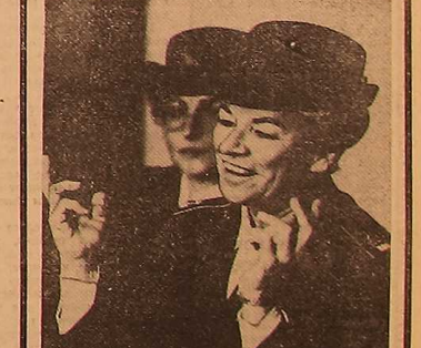
Время подписания в печать по графику в 21.30, номер подписан в 21.30.