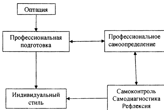
Рис. 2. Профессиональное становление личности

Профессиональное становление личности - процесс прогрессивного изменения личности под влиянием социальных воздействий, профессиональной деятельности и собственной активности, направленной на самосовершенствование и самоосуществление. Становление обязательно предполагает потребность в развитии и саморазвитии, возможность и реальность ее удовлетворения, а также потребность в профессиональном самосохранении (рис.2) [4].