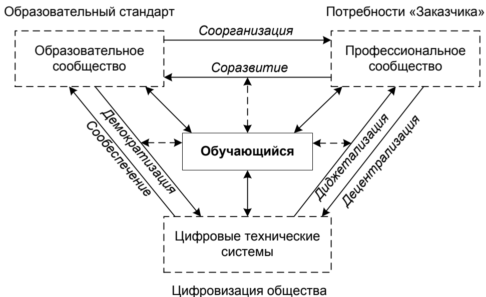
Рис. 1. Модель цифровой экосистемы образовательно-профессионального пространства вуза

Результаты исследования. Обобщение и систематизация опыта цифровизации и реализации экосистемного подхода в образовании позволили определить цифровую экосистему образовательно-профессионального пространства как сложную, локальную, саморегулирующуюся систему, способную к самостоятельной трансформации и эволюции (рис. 1).