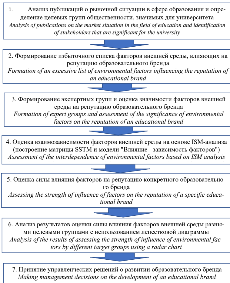
Рис. 1. Методика мониторинга репутации образовательного бренда