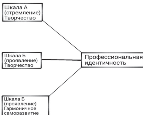
Рисунок 3 – Плеяда показателей корреляционного анализа педагогов третьей группы – со стажем профессиональной деятельности более 11 лет

психологического стремления, как достаточно гармонично организованное творчество, тем ближе статус идентичности к достигнутой или псевдопозитивной идентичности.