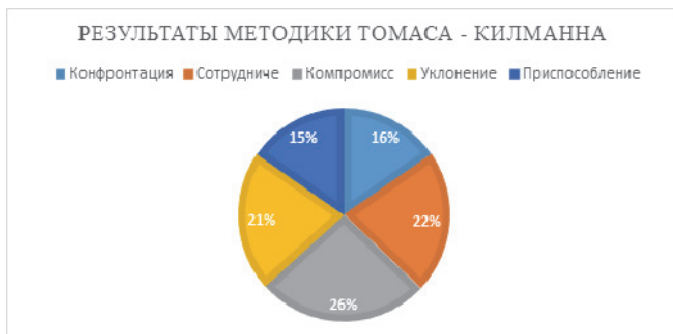
Рисунок 2. Диаграмма стратегий поведения по методике Томаса-Килманна

В группе студентов преобладающим стилем поведения выявлена стратегия компромисс (26%), далее стратегия сотрудничество (22%), стратегия уклонение (21%), стратегия конфронтация (16%), стратегия приспособление (15%).