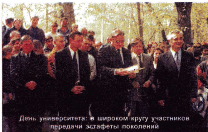
День университета: в широком кругу участников передачи эстафеты поколений

Добрые традиции связывают крепкой нитью людей разных возрастов, взглядов, разного социального положения. Связь времен необходима всем - и старшему поколению, уже оставившему свой след на Земле, и молодым, у которых все еще впереди. 26 мая студенты, преподаватели и сотрудники университета, его выпускники разных лет стали участниками празднования 21 годовщины со дня основания нашего университета и свидетелями передачи эстафеты поколений, символом которой стала капсула времени, заложённая первыми студентами нашего вуза в 1984 году. В этой капсуле хранилось послание: «Обращение-наказ выпускникам СИПИ 2000 года от первых выпускников института». Приятно сознавать, что многие из выпускников и сейчас поддерживают связь со