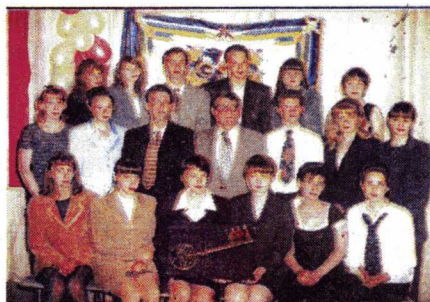
Лучшая группа университета (по группе технических специальностей) ОЛ-442 машиностроительного факультета

В этом году приём документов от абитуриентов начался необычно рано - с 5 апреля. Правда это касается заочного отделения. 22 апреля УГППУ проводил «День открытых дверей». Мы приняли более тысячи человек. Так что ожидаем достаточно большой «наплыв» абитуриентов, желающих поступить в наш университет. С 21 июня началась работа приёмной комиссии по приему документов от поступающих на дневное отделение. По сравнению с прошлым годом в «Правилах приема в УГППУ» появилось много новшеств. Это связано, в первую очередь, с введением новых государственных образовательных стандартов. В связи с этим изменились названия специализаций, по которым ведется подготовка специалистов. Также изменились условия приема медалистов и отличников. Для этих абитуриентов вводится профильный экзамен (в прошлом году - собеседование). При получении 10 баллов (на вступительных испытаниях предусмотрена десятибалльная шкала оценок) на профильном экзамене, абитуриент освобождается от дальнейших испытаний. Далее в этом году прием абитуриентов, имеющих среднее профессиональное образование, на заочное отделение с сокращенным сроком обучения ведет-