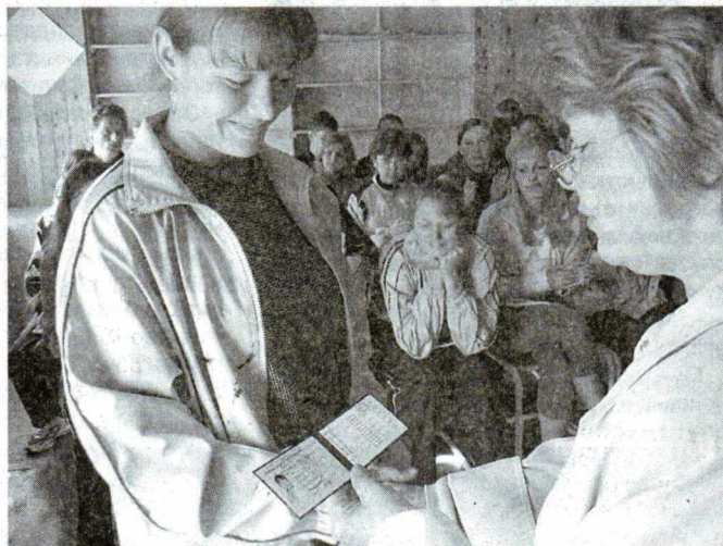
Главный документ студента