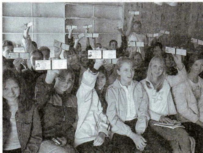
Ура! Мы – студенты РГПУ!