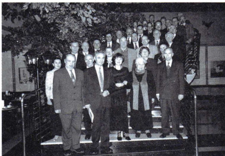
Участники Совместного заседания общего собрания Уральского отделения РАО и Президиума УГНОЦ РАО

На этом же заседании утверждены Устав Уральского отделения РАО и план научно-исследовательских работ по программе «Образование в Уральском регионе: научные основы развития и инноваций» на 2001–2005 годы.