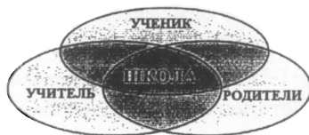
Рис.1 Школа – пространство сотрудничества образовательных субъектов

Современная школа – это прежде всего пространство сотрудничества образовательных субъектов: учителя, школьника и их родителей (рис. 1).