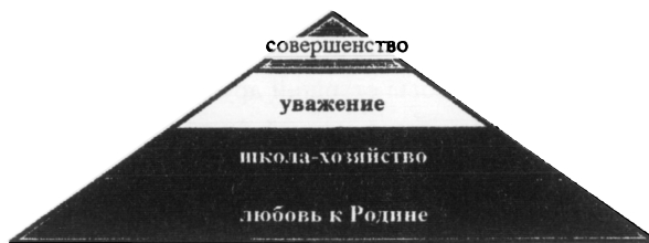
Рис.3 Пирамида успеха педагогики А.С. Макаренко

Какие нравственные ценности были у его воспитанников, и как проявлялась их взаимосвязь у колонистов и коммунаров? Попытаемся проанализировать, выделив некоторые из них: