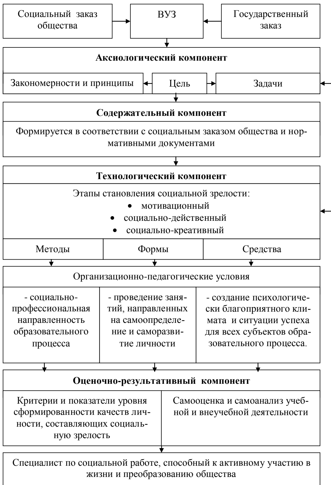
Рис. 1. Модель становления социальной зрелости студентов – будущих специалистов по социальной работе